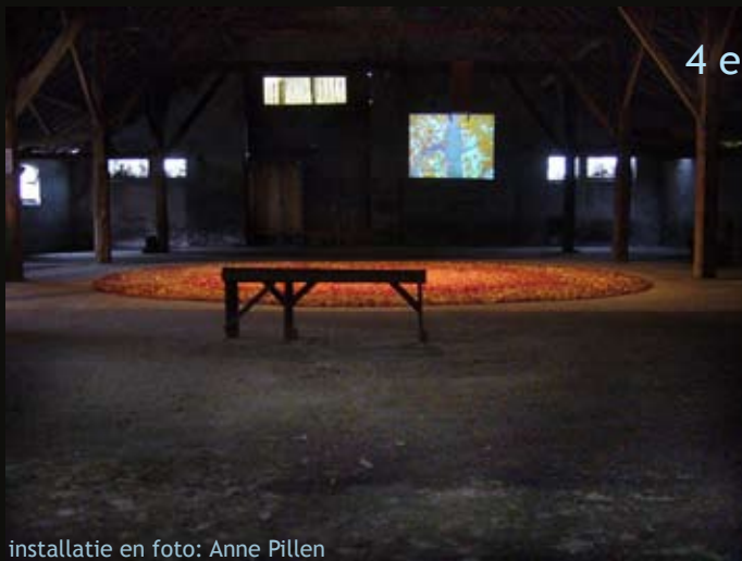
installatie en foto: Anne Pillen